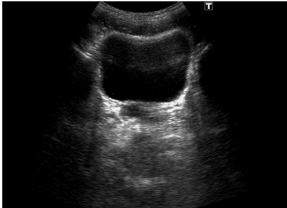
図1A 骨盤部超音波検査（3年前）